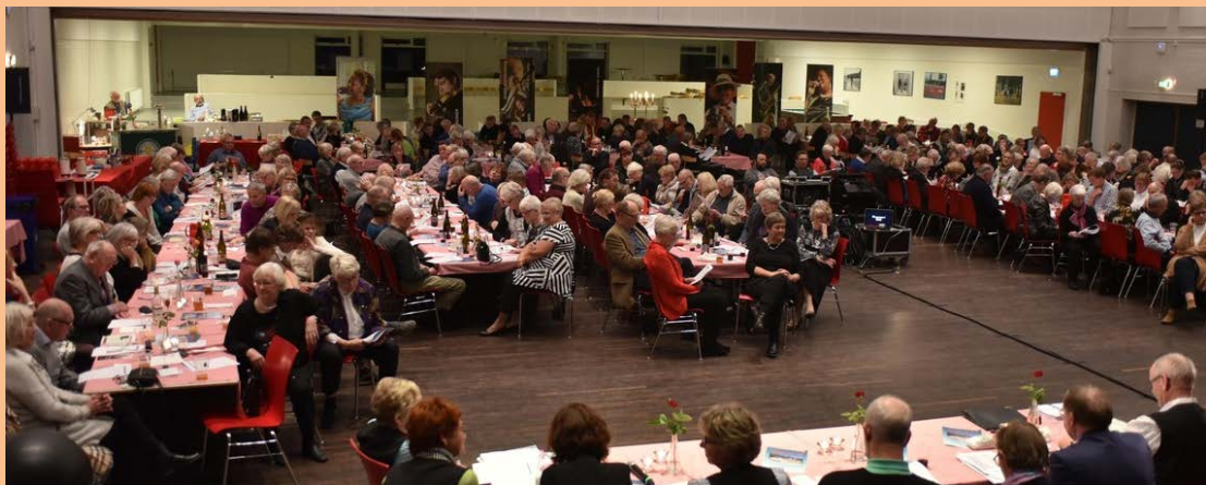
Generalforsamling 2016 – 330 fremmødte medlemmer.

Deltagelse kræver medlemskab for kalenderåret 2017. ( maden og koncerten den 3. februar 2017 er gratis )