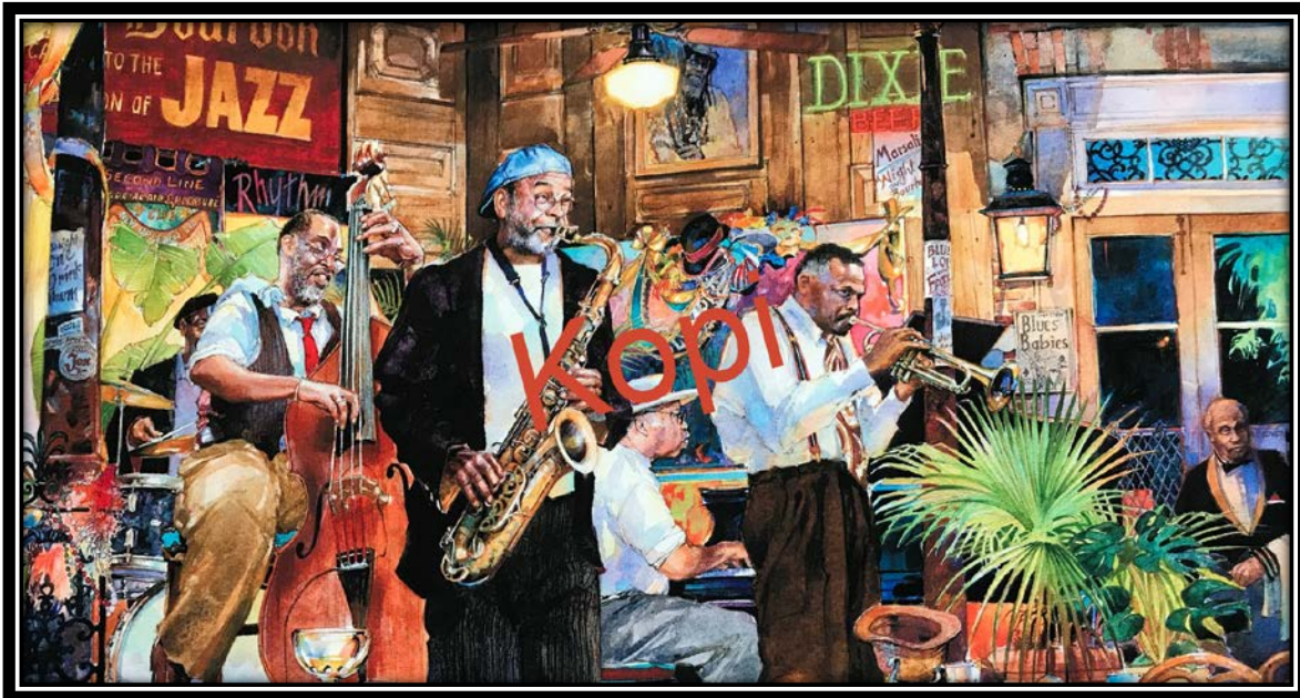
Medlemskort 2018 er tegnet af maler Tommy Thompson. Motiv: Jazz on Bourbon St..